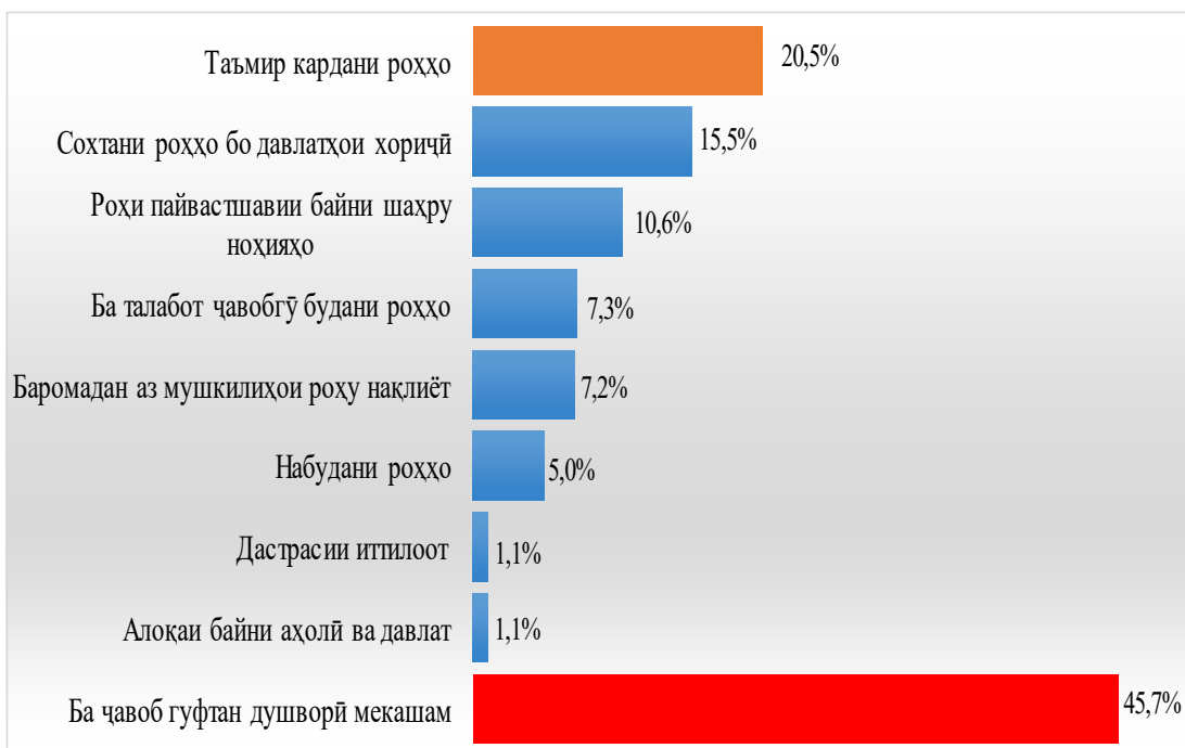
Диаграммаи 1а. Шумо зери иборати “бунбасти коммуникатсионӣ” чиро мефаҳмед? ( n=820 , %)